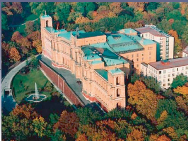
Maximilianeum, Quelle: www.bayern.landtag.de